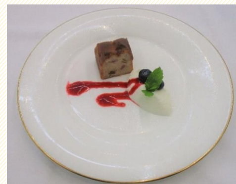
フルーツの入った ヴィジタンディーヌ (デザート)