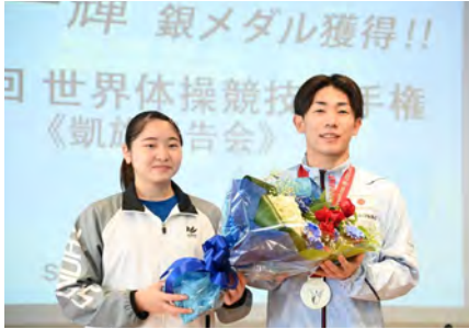
後輩から花束を受け取る南選手