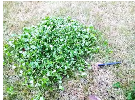
写真 8. 塗布後1週間経過 表面がしなやかに曲がっている。 枯死した部分もある。