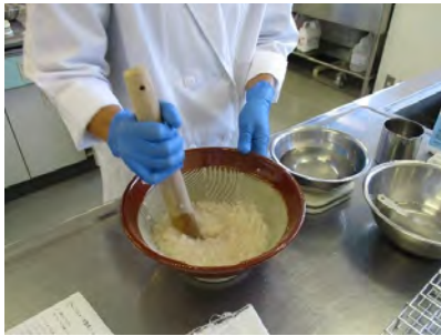
こんにやく芋をすりおろしている様子

今回の授業では、温度管理がポイントとなる授業であったため、学生の皆さんは火力や食品の形状の変化に注意しながら調理を行っていました。