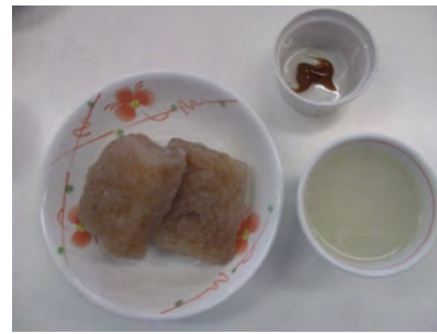
こんにやく/甘酒/水あめ