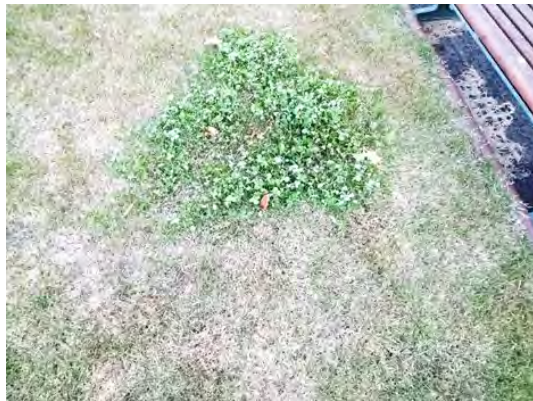
写真 7. 噴霧後1週間経過 表面がしなやかに曲がっている。 枯死した部分もある。