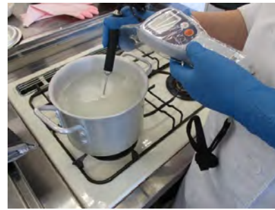
甘酒の温度管理を行っている様子