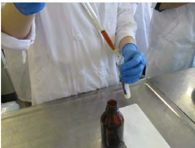
ヨウ素ヨウ化カリウム溶液を添加している様子