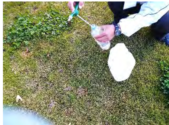
写真 3. 準備中