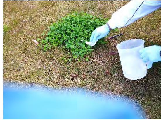
写真 5. 作業中 除草剤MCPP液剤を吸い込ませた布を直接茎葉に塗り付ける