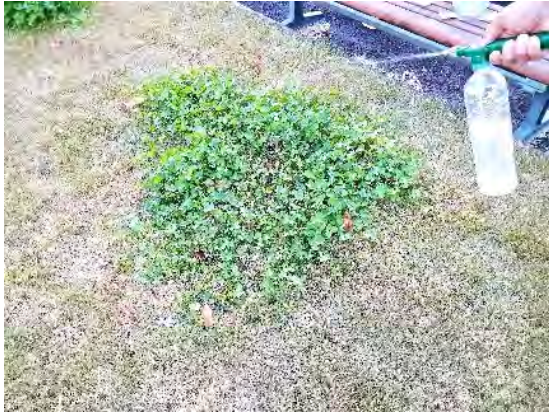
写真 4. 作業中 除草剤MCPP液剤を噴霧器で散布する