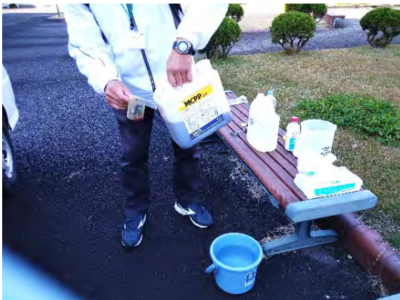
写真 2. 道具一式