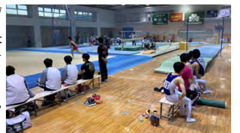
仙台大学を会場に開かれた東北・北海道学生選手権大会