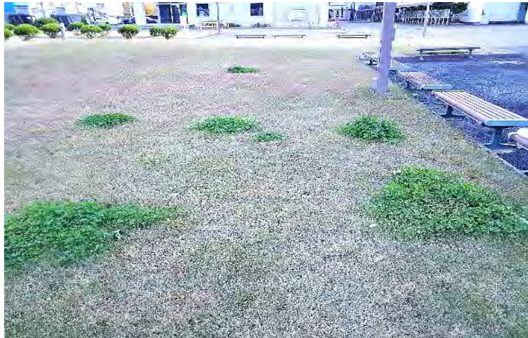
写真 1. 遠景、3体前

自宅の庭でも簡単にできる方法を紹介します。100円ショップで小型噴霧器と1,000cc入りのボトルを購入します。薬剤は100倍から400倍に希釈するので計算しやすい容器を準備します。園芸店で購入したMCP液剤（他に「シバゲン水和剤やアージラン液剤」などもある）を状況に合わせた希釈量をビーカーなどで計量しながら1,000ccの水を入れた容器に入れてよく振って混合させます。混和した除草剤をペットボトルに入れて小型噴霧器を装着して直接クローバーに霧状に散布します。散布量は満遍なく葉っぱに掛るようにします。2週間から1か月経過すると効果が出てきます。噴霧器を手配できないときは<写真-5>のとおり希釈した薬剤を布などに染み込ませて直接茎葉に擦り付けます。ゴム手袋を使用して薬剤が直接手に触らないように注意します。